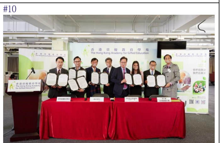
#9&10 香港资优教育学苑与播道书院、香港浸会大学附属学校王锦辉中小学及圣公会白约翰会督中学进行进行签署仪式。