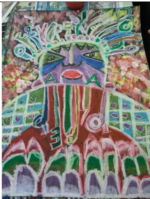
画作，于 6 岁时创作

从幼儿园开始我就十分喜爱粤剧，我被五彩缤纷的颜色吸引着，但是妈妈没有给我学粤剧，于是我便拿出纸笔用粉彩画上面谱，那对称的图案那时的我觉得十分有趣，然后放上面唱《帝女花》给爸爸妈妈听。