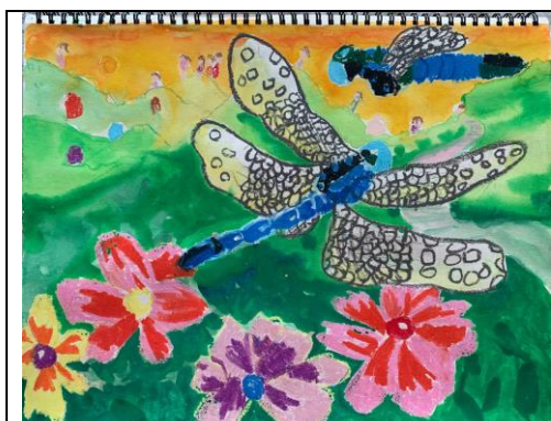
画作，于 5 岁时创作

这是我 5 岁时画的画，它描绘了蜻蜓在空中飞舞的情景。我小时候特别喜欢会飞的动物和昆虫，牠们鼓励我展翅高飞，所以我画这幅画的时候非常兴奋。