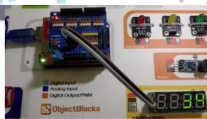
3. Hands-on product