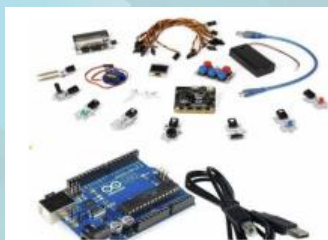
1. Arduino and Devices